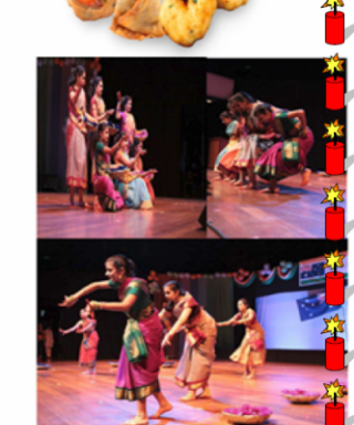
Indian Multicultural Danges

Sunday, 6 November 2011, From 11am to 3pm @ Murdoch University Bush Court Visit our website for more details pavalifestivalperth.com.au/ http://